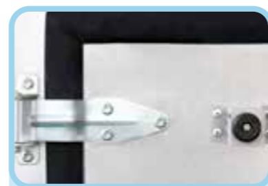
Bản lề nhập khẩu với chất liệu thép đúc