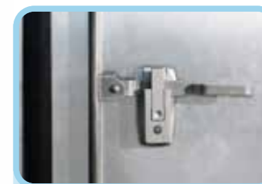
Khóa cửa thùng kiểu thép đúc được nhập khẩu