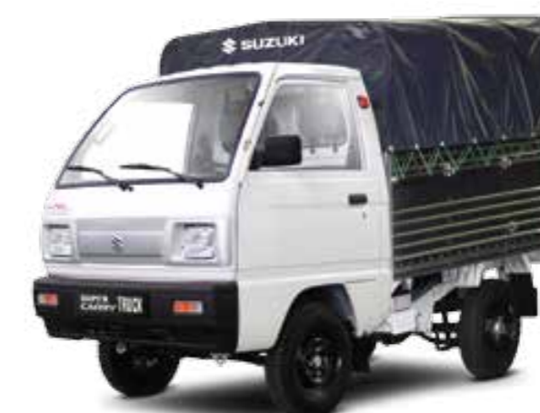
TRUCK MUI BẠT