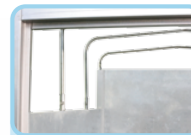
Kèo bạt có thể tháo lắp dễ dàng tùy theo nhu cầu sử dụng