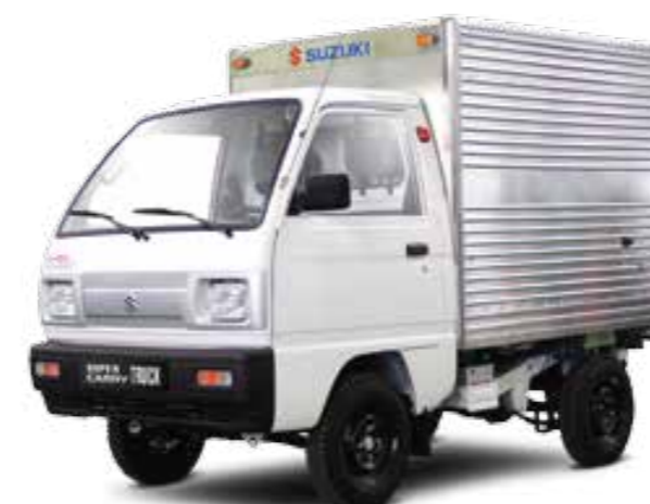
TRUCK THÙNG KÍN