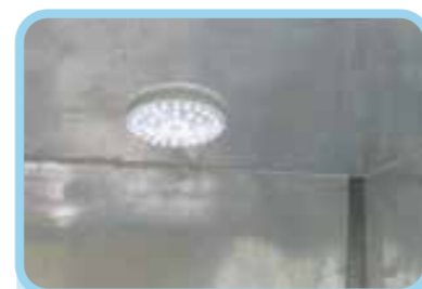
Đèn thùng & công tắc bên trong cabin được thiết kế thuận tiện